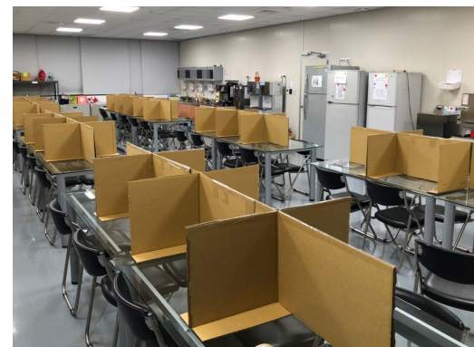
員工用餐區域設置隔板，以維持社交距離。